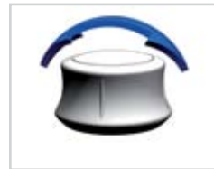
Rotazione su se stesso